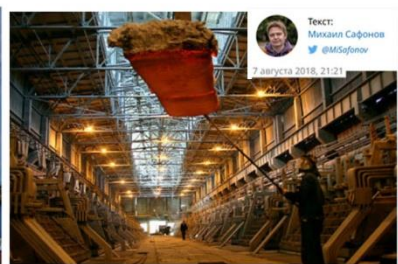
На заводе в поселке Надвоицы сокращения пока не планируются, заявили власти Карелии. Из-за санкций США «Русал» решил законсервировать там производство.

Речь идет о небольшом заводе компании Олега Дерипаски. Раньше продукция предприятия уходила в США, теперь — на склад. Завод в Надвоицах — градообразующий