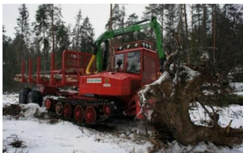
Арбитражный суд Карелии начал процедуру банкротства на старейшем заводе Карелии. Как сообщается на сайте суда, просроченная задолженность предприятия составляет 4,4 млн рублей.