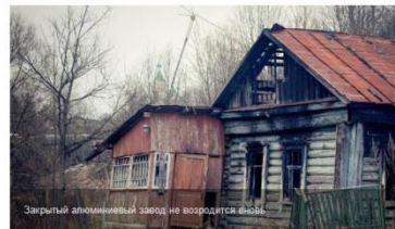
Надвоицкий алюминиевый завод некогда был гордостью промышленности Карелии. Но в 2018 году владевший им «Русал» закрыл на нем производство алюминия. Создававшееся на его мощностях предприятие «Русский радиатор» пока толком не работает. Зато «Русал» судится с коммунальщиками Надвоиц. В чем суть тяжбы и каковы перспективы Надвоиц, разбирался «ФедералПресс».